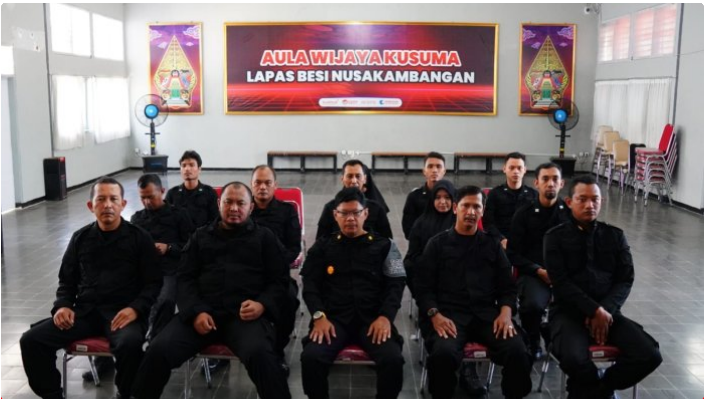
Lapas Besi Ikuti Sosialisasi Konversi Penilaian Kinerja Jabatan Fungsional

CILACAP – Lembaga Pemasyarakatan Kelas IIA Besi Nusakambangan mengikuti kegiatan Sosialisasi Konversi Penilaian Kinerja Pegawai Menjadi Angka Kredit dalam Jabatan Fungsional, (01/02/2024).