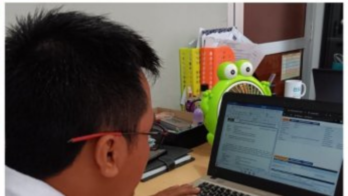
Optimalisasi Penggunaan SDP pada Balai Pemasyarakatan Kelas II Nusakambangan

Nusakambangan - SDP (Sistem Database Pemasyarakatan) adalah salah satu program unggulan berbasis teknologi informasi dari Dirjenpas (Direktorat Jenderal Pemasyarakatan) Kemenkumham RI yang berbentuk sistem mekanisme pengelolaan data warga binaan Pemasyarakatan (WBP) dan klien pemasyarakatan. SDP terus mendapatkan pembaruan untuk optimalisasi fitur-fitur di dalamnya. Pembekalan yang diberikan kepada Operator SDP antara lain untuk melakukan update patch SDP secara berkala karena terdapat berbagai fitur baru yang disesuaikan dengan hadirnya Undang-Undang Nomor 22 Tahun 2022 tentang Pemasyarakatan.